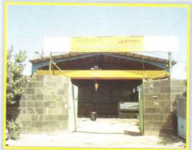
نمایی از شرکت