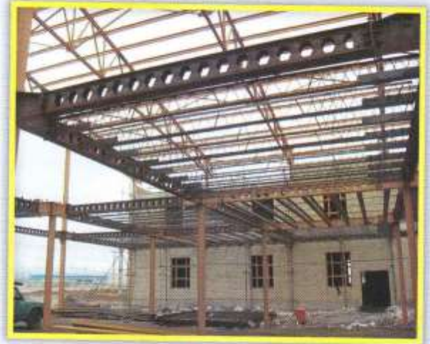
ساخت پروژه دانشگاه آزاد ری (سوله)