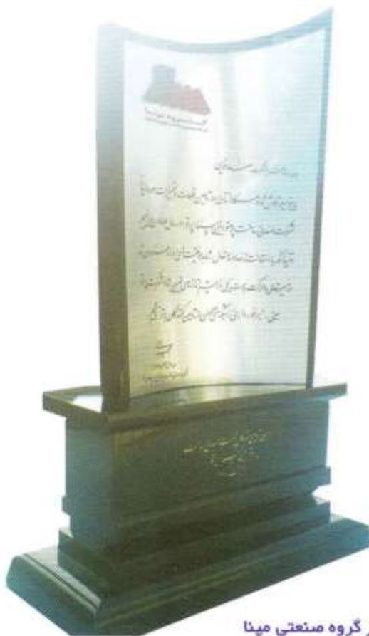
لوح تقدیر از گروه صنعتی مینا

بدون شک تمامی این موفقیتها مرهون سالها کار تلاش و تجربه است . این امر تحقق نخواهد یافت مگر با تلاش . کوشش و ایمان به خداوند