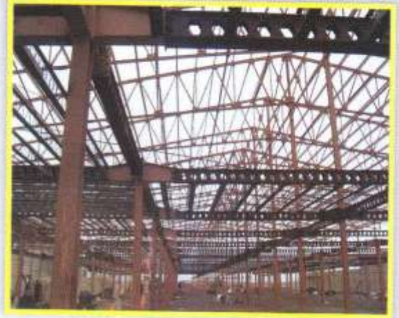
ساخت پروژه آب و برق کیش